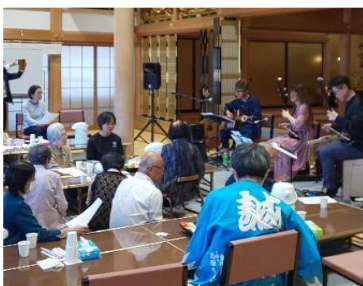
【二胡コンサートの様子】