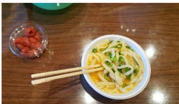
【衝撃の讃岐うどん】